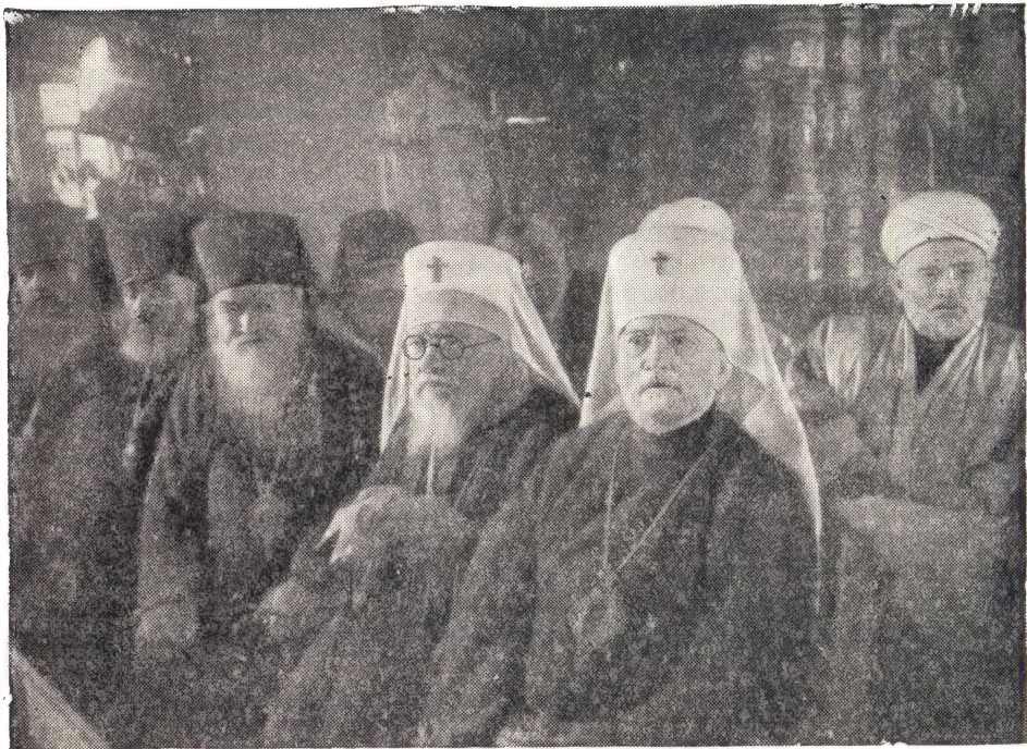
ГРУППА ДЕЛЕГАТОВ НА ЗАСЕДАНИИ КОНФЕРЕНЦИИ

кова. Его речь носила характер призыва к братству народов и протеста против чудовищных злодеяний американских агрессоров. Он подробно рассказал о деятельности баптистских общин и членов их, направленной к защите мира.